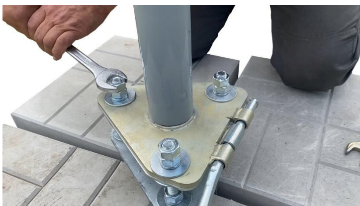
Схема монтажа крепления откидного основания к сварному.